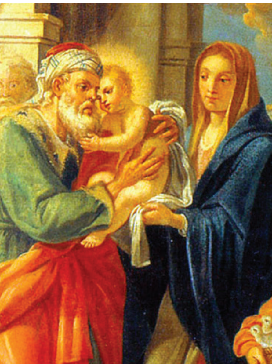
Presentazione di Gesù al Tempio, tela, XVIII secolo, Cattedrale di Santa Maria Assunta, Melfi.