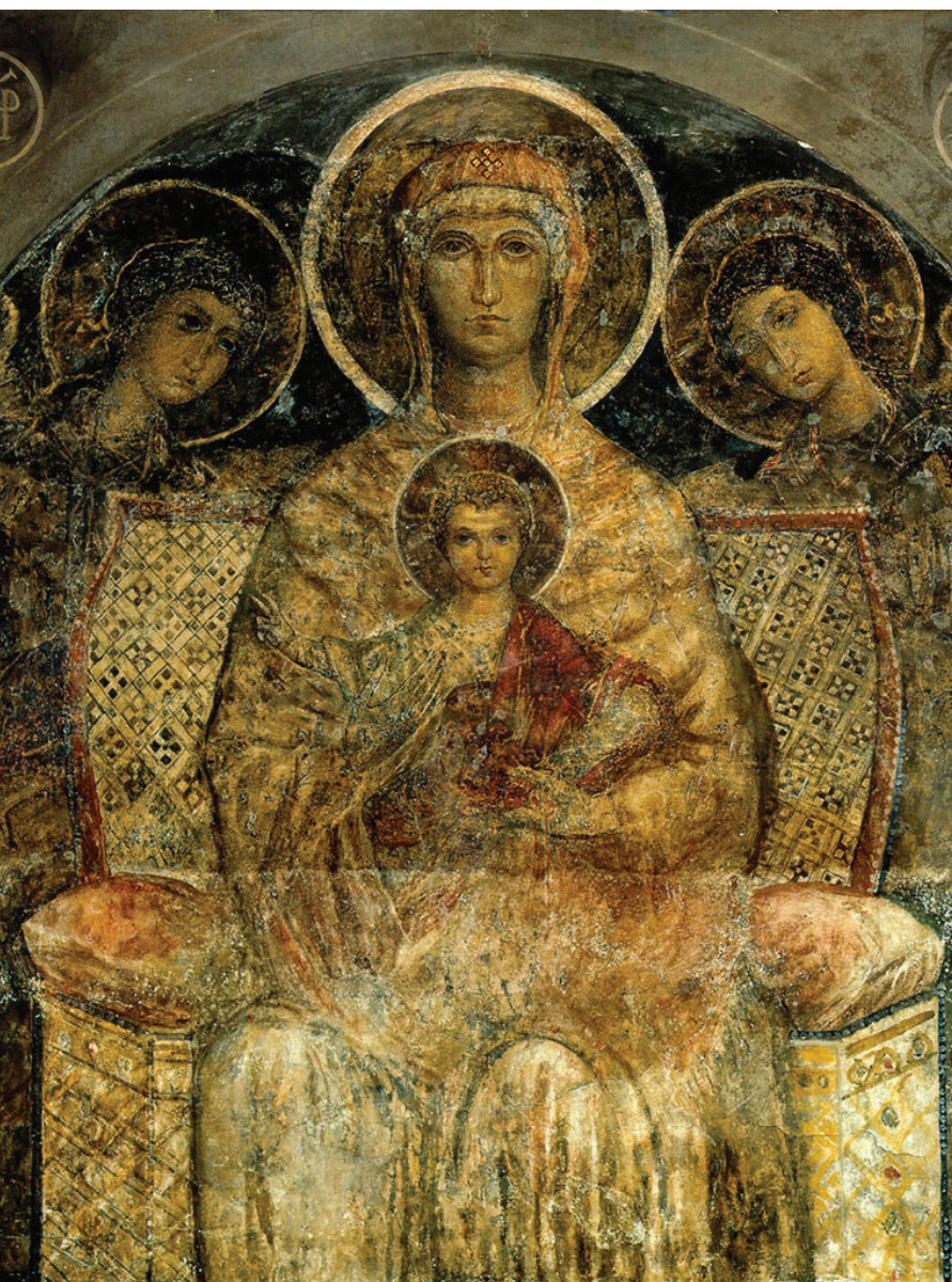
Vergine in trono con Bambino, detta anche Madonna bizantina, affresco, XIII secolo, Cattedrale di Santa Maria Assunta, Melfi.