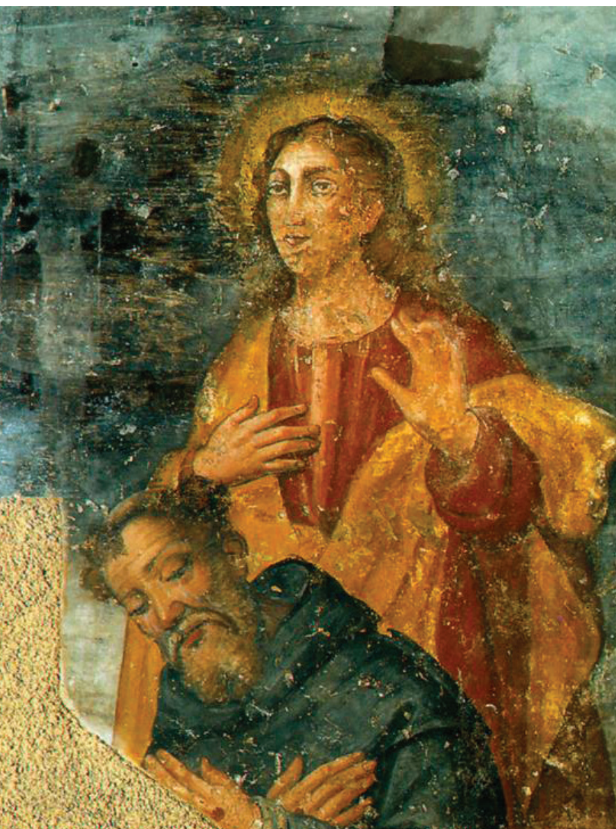
S. Giovanni e S. Francesco d' Assisi, affresco, XV secolo, Cattedrale di Santa Maria Assunta, Melfi.