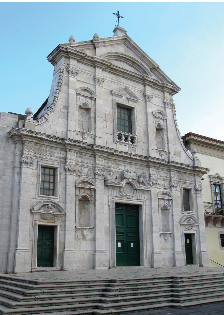
Cattedrale di Santa Maria Assunta, sec. XI, Melfi.