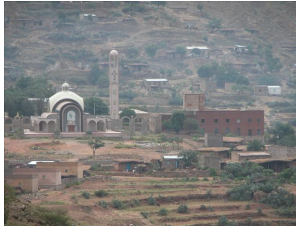
Villaggio di Hebo con Santuario di S. Giustino de Jacobis

Le strutture e gli impianti della lavanderia dell'Orfanotrofio di Hebo necessitano di urgenti lavori di manutenzione e di ammodernamento al fine di renderli più efficienti e nello stesso tempo garantire l'utilizzo ottimale delle risorse idriche, già molto scarse.